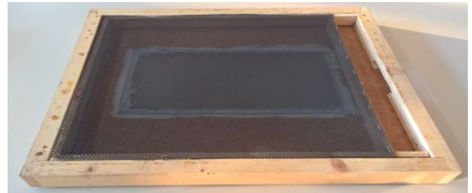
Alternativ aus Fluglingsbrett gebaut von oben