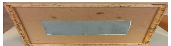
Milbenfalle von unten gesehen