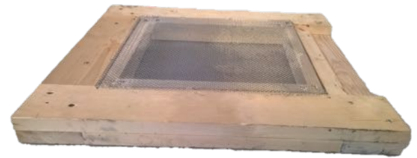
Milbenfalle von oben gesehen