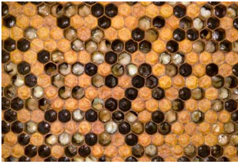
Durch Sauerbrut stark befallene Brutwabe.

1 INSTITUT GALLI-VALERIO, LAUSANNE; 2 ZENTRUM FÜR BIENENFORSCHUNG, AGROSCOPE ALP-Haras; 3 VPH INSTITUT, UNIVERSITÄT BERN, 4 KANTONSTIERARZT ST. GALLEN