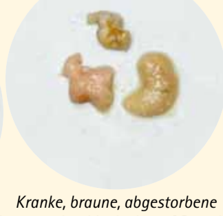
Kranke, braune, abgestorbene Bienenmaden, Verdacht auf Sauerbrut