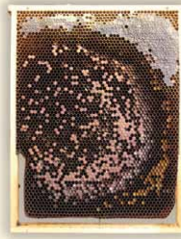
Kranke Brut stark lückenhaftes Brutnest