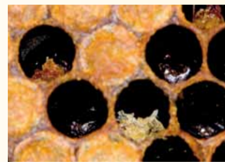
Die Larven trocknen ein und es bildet sich ein Krümel.