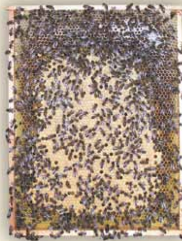
Gesunde Brut lückenloses Brutnest

Das Erscheinungsbild der Faul- und Sauerbrut ist optisch sehr ähnlich. Infolge dieser Verwechslungsgefahr ist eine sorgfältige Diagnose wichtig.