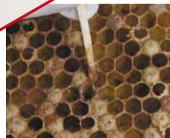
Bei der Sauerbrut reisst der Faden nach 3 mm ab.