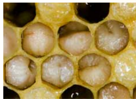
Gequollene Bienenlarven deuten auf Sauerbrut