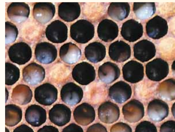
Schlaffe, gequollene, gelblich braune Rundmaden deuten auf Sauerbrut.