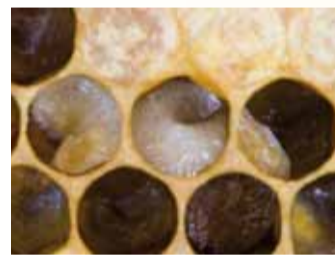
Die Larven verfärben sich gelblich bis bräunlich.