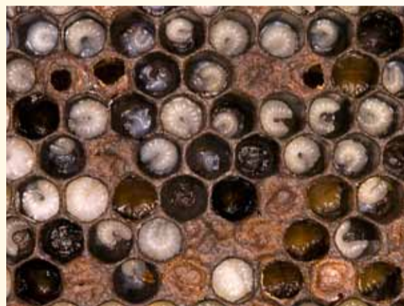
Bei der Faulbrut sind die Brutzellendeckel löchrig und eingesunken.