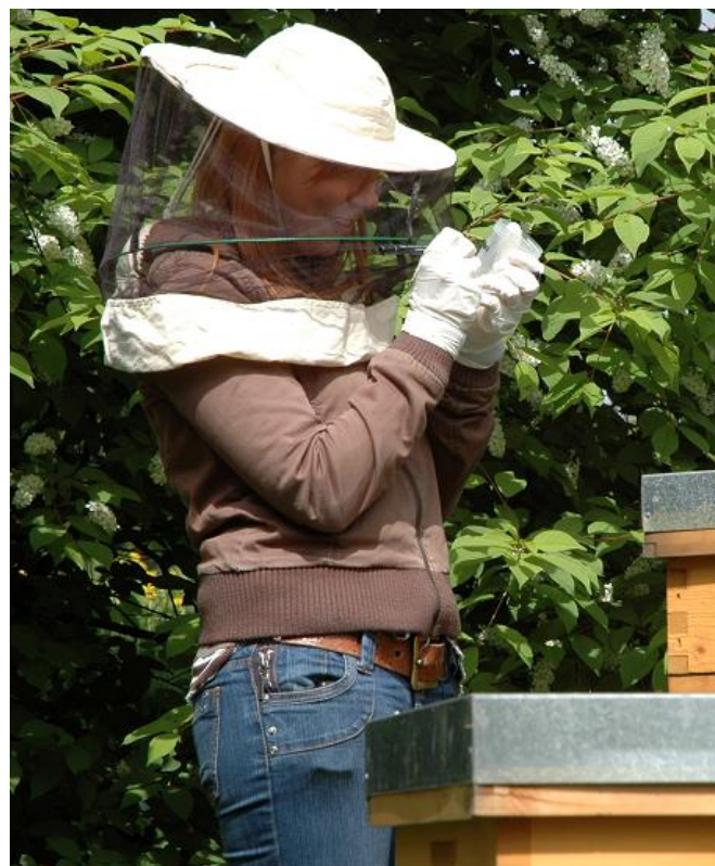
Beschriftung der Becher für Bienenprobe

Wesentliche Teile der alternativen Varroabekämpfung (AVB) wurden von der «internationalen Varroagruppe» unter der Leitung des Schweizerischen Zentrums für Bienenforschung (Agroscope Liebefeld-Posieux ALP) entwickelt.